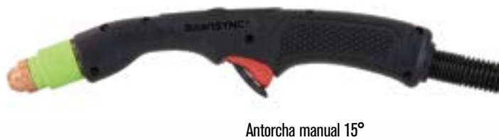
Antorcha manual 15°