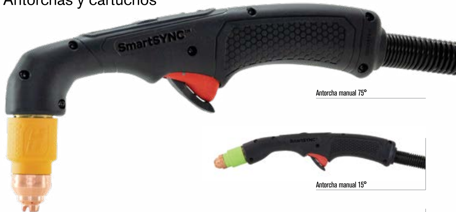
Antorcha manual 75°