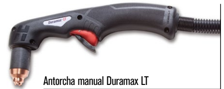
Antorcha manual Duramax LT

(visitar www.hypertherm.com para más opciones de antorchas)