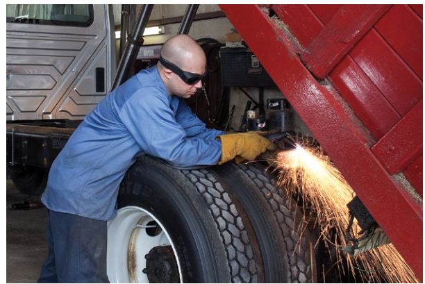
Reparación y modificación de vehículos