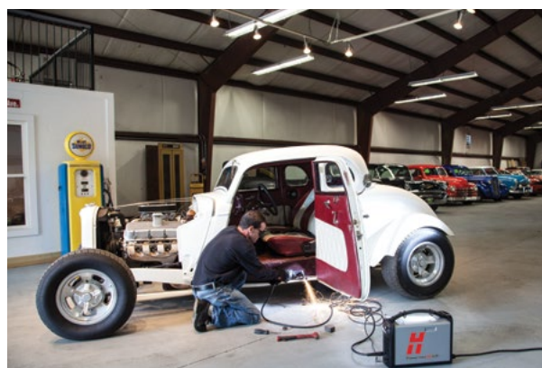
Reparación y modificación de vehículos